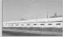
ALP OVERSEAS PVT. LTD. (RISHAPUR, UK)

EPDM/ PVC/ TPE/ TPR/ EXTRUDED WEATHER STRIPS - PLASTIC MOULDED PARTS - NITRILE/ EPDM FOAM INSULATION