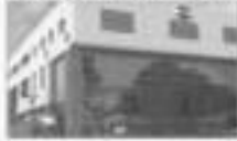
ALP PLASTICS PVT. LTD. (GURGAON, HARYANA)