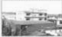
ALP NISHKANTH CO. PVT. LTD. (LAGRU (PUNJAB))