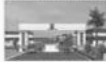
ALP POLYMER PARK PVT. LTD. (JODALKOTA, NISHKANTH RAJASTHAN)