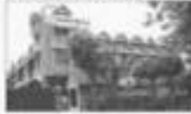
ALP AEROFLEX INDIA P. LTD. (NOIDA, UP)