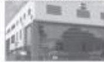
ALP PLASTICS PVT. LTD. (GURGAON, HARYANA)