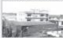
ALP MUMBAI CO. PVT. LTD. (MUMBAI, INDIA)