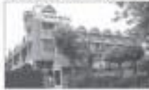
ALP AEROFLEX (INDIA) LTD. (MUMBAI, INDIA)