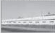
ALP OVERSEAS PVT. LTD. (MUMBAI, UK)

EPDM/ PVC/ TPE/ TPR/ EXTRUDED WEATHER STRIPS - PLASTIC MOULDED PARTS - NITRILE/ EPDM FOAM INSULATION