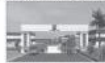
ALP POLYMER PARK PVT. LTD. (GUGALGOTA, HIMACHAL PRADESH)